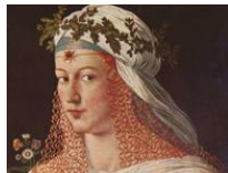
Lucrezia, la «santa» dei Borgia